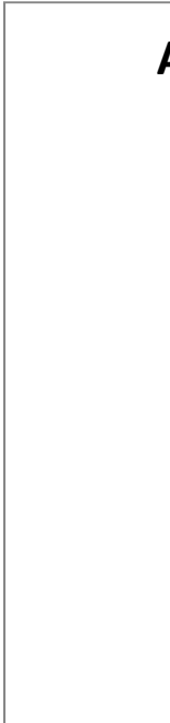
Grafico # 3:

Fuente: Datos de la Escuela. "Escuela "Esi Tosagua" 200