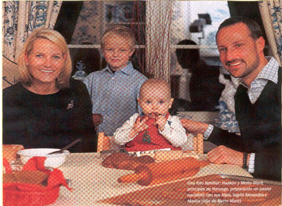
Una foto familiar: Haakon y Mette-Marit, príncipes de Noruega, preparando un pastel navideño con sus hijos, Ingrid Alexandra y Marius (hijo de Mette-Marit)