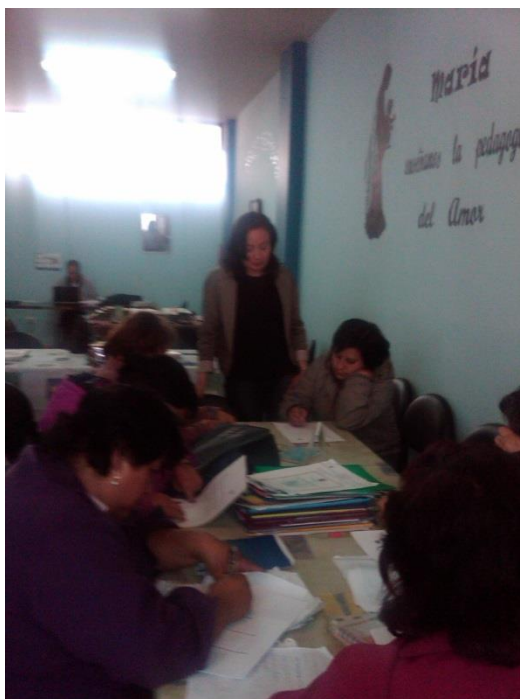
Foto2.- Estudiantes de noveno B, respondiendo a la encuesta.