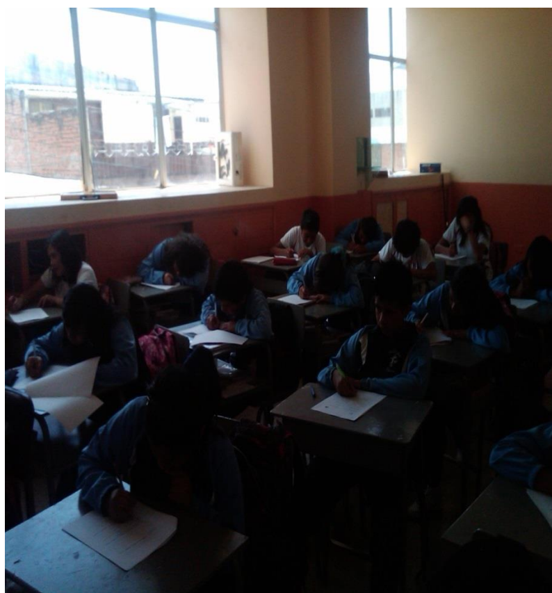
Foto 4.- Aplicando la encuesta a alumnos de 9no A