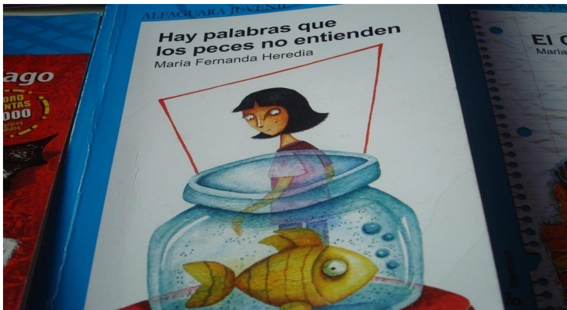
Portada obra literaria.