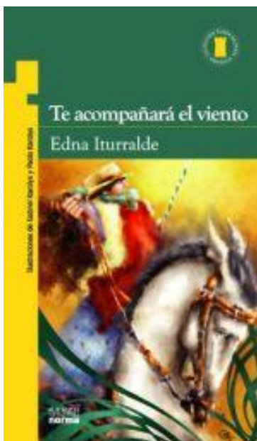
Te acompañará el viento

Quito: Grupo Editorial NORMA, primera impresión 2008, segunda impresión 2009, tercera reimpresión 2010, cuarta reimpresión 2011, quinta reimpresión 2012