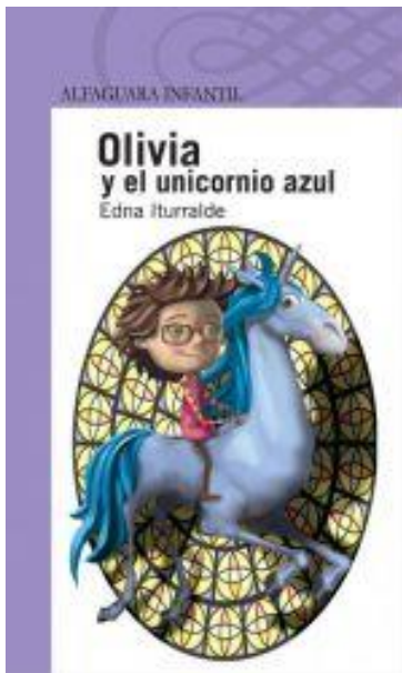
Olivia y el Unicornio azul

Quito: Editorial Alfaguara, Grupo Santillana S.A., primera impresión 2008, segunda reimpresión 2009, tercera reimpresión 2010, cuarta reimpresión 2011, quinta reimpresión 2012