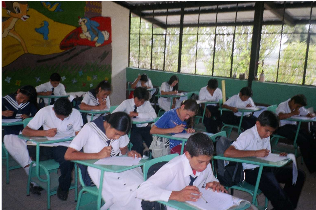
4.- Alumnos del Noveno Año de Educación Básica