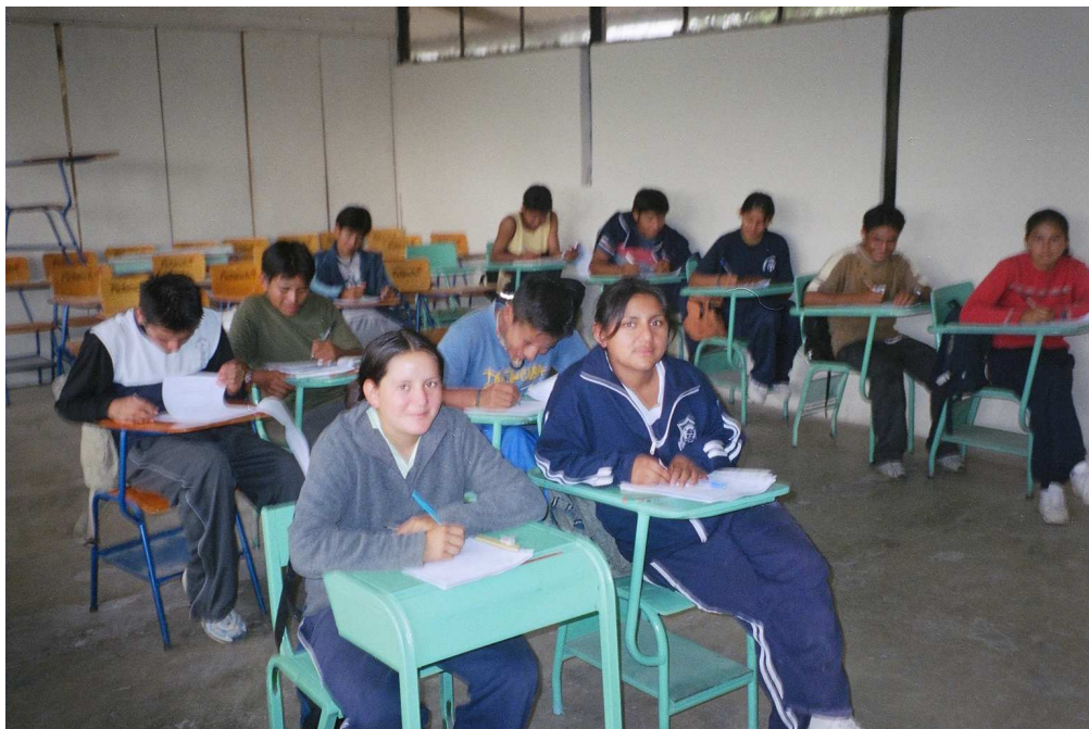
3.- Alumnos del Primer Año de Bachillerato Químico – Biólogo