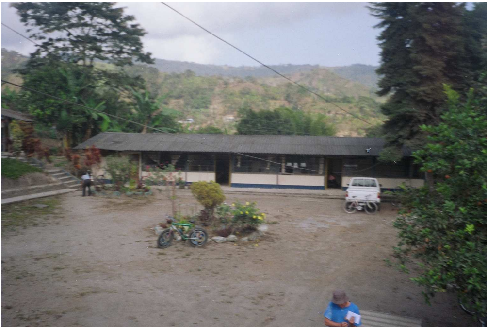
1.- Colegio Nacional Técnico "Nanegal "

El número de personas investigadas ascendió a 118 entre las que están: 31 alumnos de la educación básica, 26 de diversificado (bachillerato técnico en Químico Biólogo), 30 estudiantes universitarios, 11 profesores del Colegio y 20 profesores universitarios