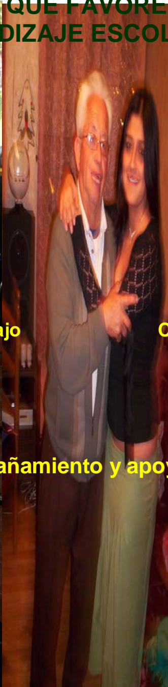
El acompañamiento y apoyo familiar